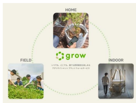
ベランダ・ビルの屋上・屋内あらゆる場所にタッチポイントを