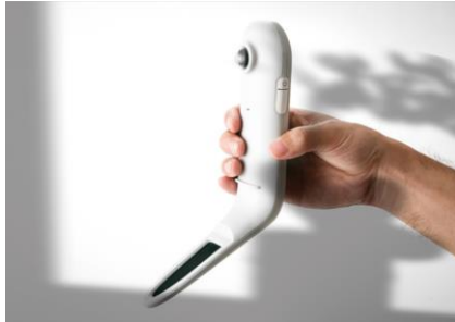
IoT センサー「grow CONNECT」

プランティオ株式会社は、「持続可能な食と農をアグリテインメントな世界へ」をビジョンに、オフィスビルの屋上や、マンションなどの屋内でたのしくアーバンファーム（都市農）を行う為の、農を DX 化した次世代型アグリテインメントプラットフォーム「grow」を展開しています。