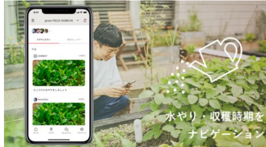
野菜栽培をタイムリーにナビゲーション